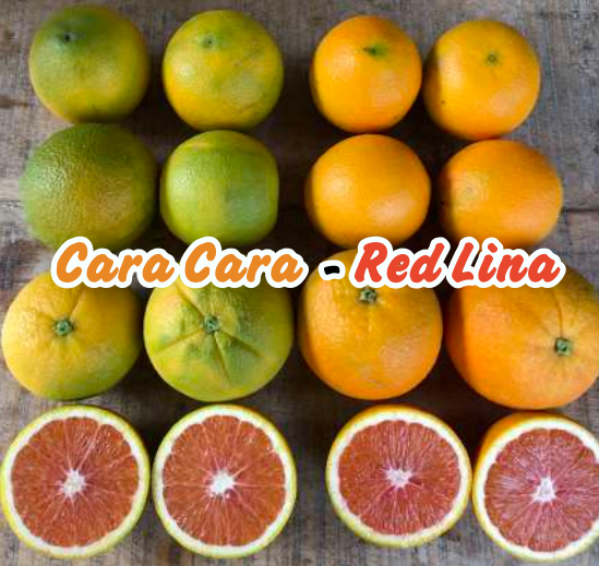
Cara Cara - Red Lina