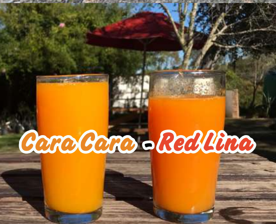
Cara Cara - Red Lina